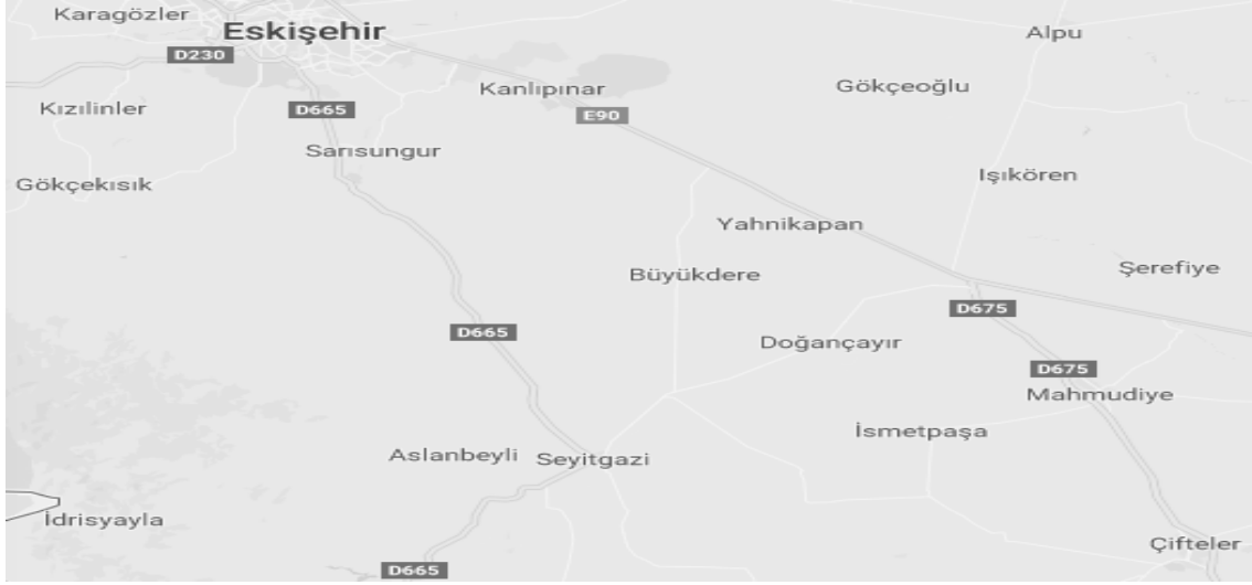
Fig. 2. Eskişehir İli, Seyitgazi İlçesi ve Yakın Çevresi.

bir sunu olmakla beraber Nakoleia'daki Asklepios kültüne dair epigrafik anlamda yeni bir kanıt teşkil etmektedir 8 . Yazıtta Asklepios'un dışında başka bir tanrı/tanrıçadan ise söz edilmemektedir. Hâlbuki Phrygia'da Apollon, Dea Roma, Herakles, Men, Nemesis, Serapis ve Zeus gibi pek çok tanrı/tanrıçanın Asklepios ile beraber yer aldığı bilinmektedir 9 . Ancak bunların arasında şüphesiz Hygieia ilk sırada yer almaktadır 10 . Bölgede pek çok kentte bu durum gözlenmekte olup, Nakoleia'da da Asklepios ve Hygieia'nın beraber gösterildiği sikkeler bilinmektedir 11 . Diğer yandan Phrygia'da elimizdeki yazıtta olduğu gibi Asklepios'un tek başına yer aldığı epigrafik buluntular da mevcuttur. Söz gelimi Aizanoi 12 , Aludda (Aluddis) 13 , Çavdarlı 14 , Dionysopolis (Zeyve) 15 , Afyon (Kale Köy) 16 , Kurudere 17 ve Midas Kale'den (Yazılıkaya) 18 ele geçen yazıtlar buna örnek gösterilebilir 19 . Aynı şekilde Phrygia'daki pek çok sikke üzerinde de Asklepios yine tek başına yer almakta olup 20 , Nako-